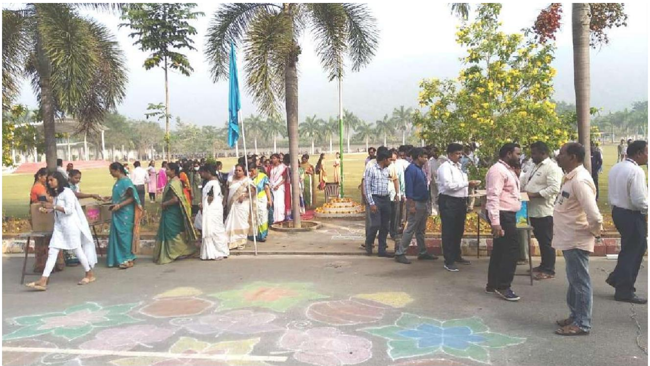
Distribution of sweets & snacks