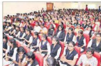
సదస్సుకు హాజరైన విద్యార్థినులు