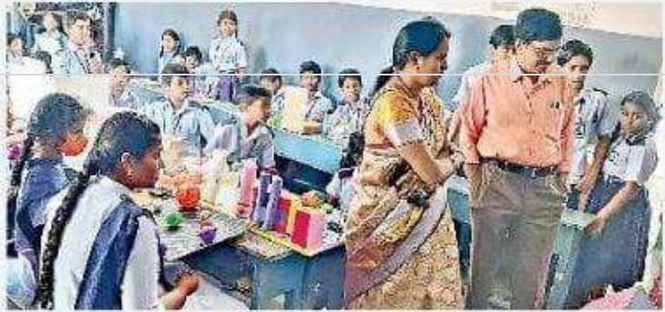
సుధహా పాఠశాలలో ప్రదర్శన తిలకిస్తున్న ఉపాధ్యాయులు

తిరుపతి(మహిళా వర్సిటీ, విద్య), తిరుమల, న్యూన్ టుడే: జాతీయ వైజ్ఞానిక డిన్ టెన్త్ వాన్ని పురస్కరించు కొని మంగళవారం పలు పాఠశాలల్లో విజ్ఞాన ప్రదర్శనలు ఏర్పాటు చేశారు. ఉత్తమ ప్రతిభ కనబరిచిన విద్యార్థులకు బహుమతులు అందజేశారు. తిరుమల శ్రీ వేంకటేశ్వర ఉన్నత పాఠశాల, శ్రీ పద్మావతి మహిళా డిగ్రీ, పీజీ, జూనియర్ కళాశాలలు, తిరుపతి సుధహా, రెడ్ చెర్రీస్, జీవకోనలోని విశ్వం విద్యాసంస్థలు, జీఎస్ మాధ వీధిలోని శ్రీచైతన్య పాఠశాల, పరసాల వీధిలోని మున్సిపల్ పాఠశాల, కరకం బాడీ మార్గంలోని ఎస్వీ కాలేజ్ ఆఫ్ ఇంజనీరింగ్ కళాశాల, నారాయణ రోడ్డులోని గౌతమ్ పాఠశాల, కరకంబాడీ రోడ్డులోని శ్రీ సుం ఇంజనీరింగ్ కళాశాల, తిరుపతిలోని శ్రీ శేషాచల పాఠశాల, నారాయణ పాఠశాలలో విద్యార్థులు పలు రంగాలలో నమూనాలను ప్రదర్శించారు.