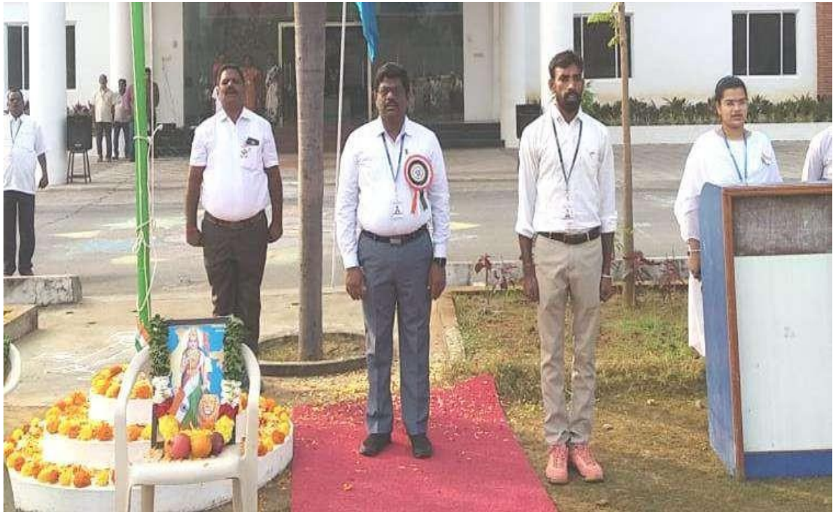
Paying attention to National anthem