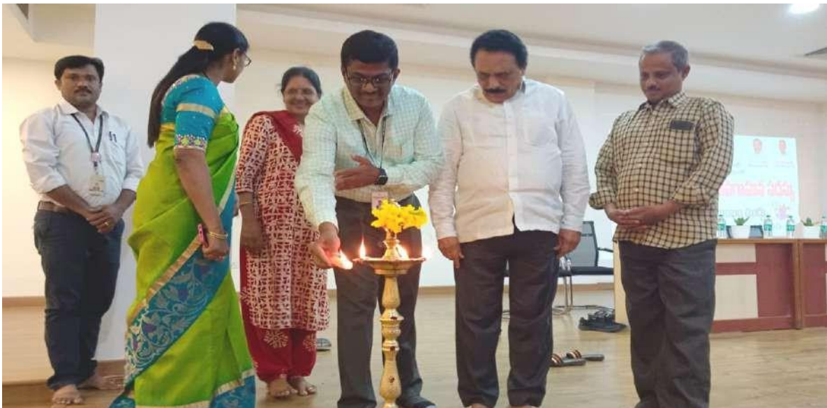
Lightening the lamp