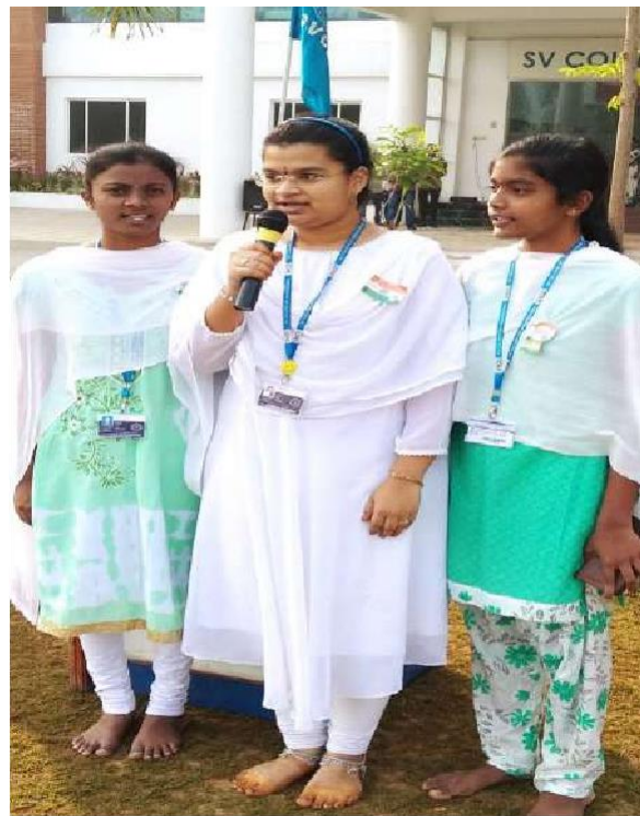
Patriotic song by students