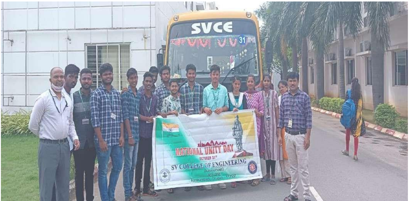
NSS Unit with the banner