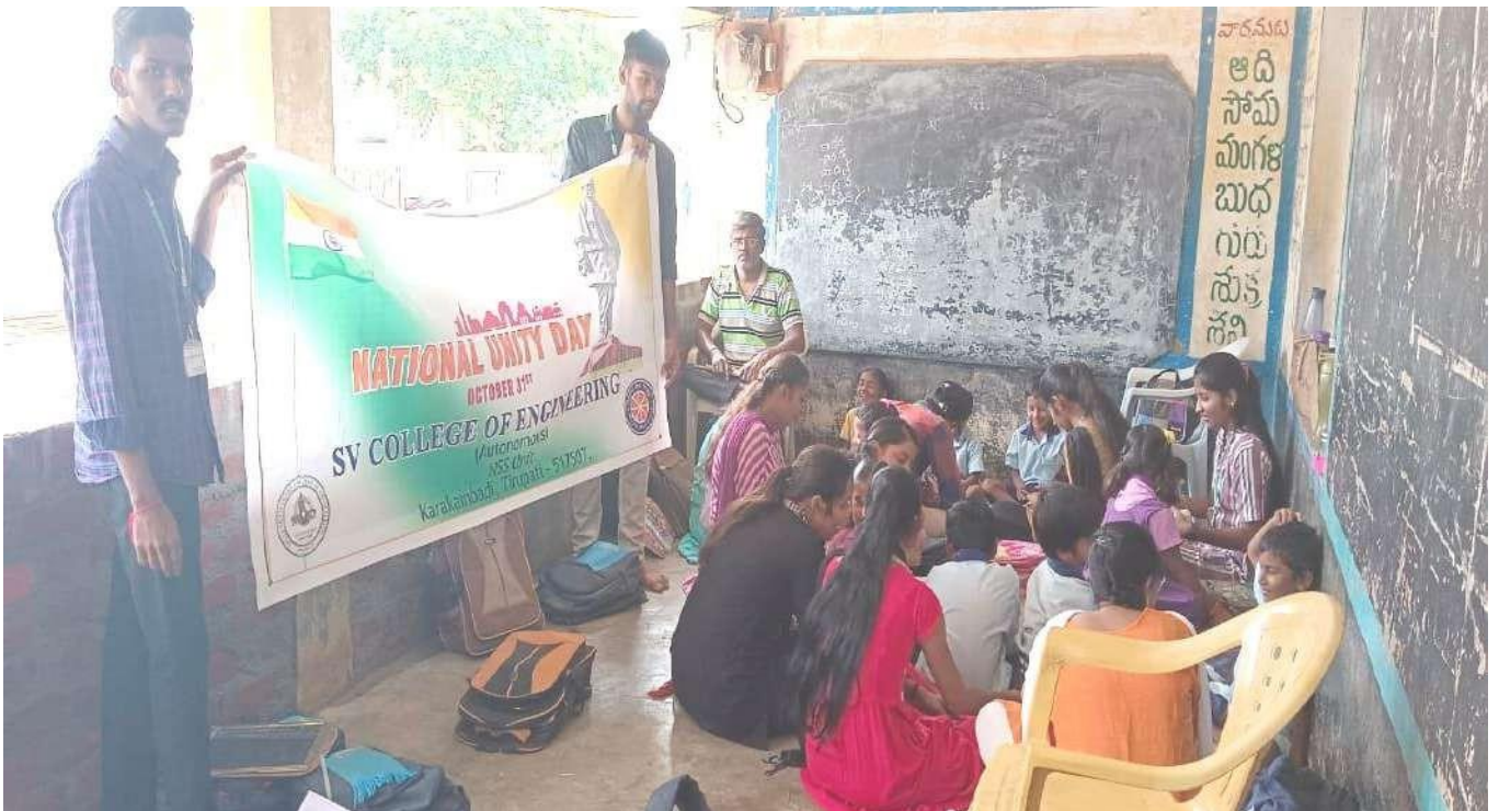
Interaction with the school children