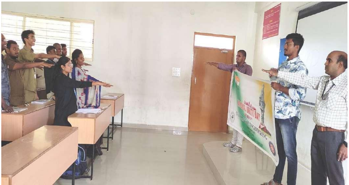
Pledge taking ceremony